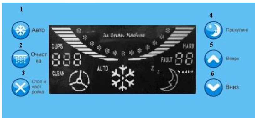
Рис. 1 Дисплей панели управления. Отображения основных функций. Кнопки управления.