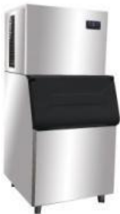
рис1. Общий вид оборудования

Модель FA оснащены увеличенный бункер для временного хранения произведенного льда.