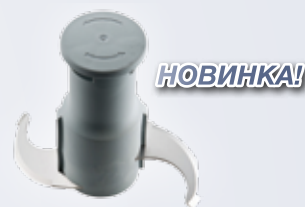
Гладкий роторный нож – гомогенизатор