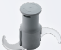
Микрозубчатый роторный нож